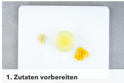
1. Zutaten vorbereiten

Energie 598kcal, Fett 36.9g, Kohlenhydrate 30.7g, Eiweiß 35.6g