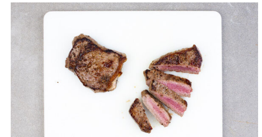
6. Fleisch schneiden

Den Perlencouscous in das kochende Wasser rühren und abgedeckt bei mittlerer Hitze 8-10Min. sanft köcheln lassen, bis das Wasser aufgesaugt und der Perlencouscous gar ist.