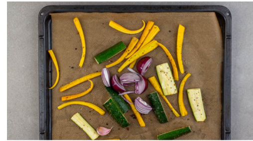
2. Gemüse rösten

Das Fleisch trocken tupfen und von beiden Seiten mit je 1 Prise Salz und Pfeffer sowie dem restlichen Grillgewürz würzen. In einer mittelgroßen Pfanne mit 1EL Olivenöl bei starker Hitze auf jeder Seite 2-3Min. braten, abhängig davon, ob es medium oder eher durchgebraten sein soll. Aus der Pfanne nehmen und bis zum Servieren auf einem Teller abgedeckt ruhen lassen.