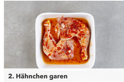
2. Hähnchen garen

Den Backofen auf 240°C (220°C Umluft) vorheizen. In einem mittelgroßen Topf 600ml Wasser für den Bulgur zum Kochen bringen. Die Hähnchenteile trocken tupfen und rundum mit dem Sambal Oelek und 1 kräftigen Prise Salz einreiben.