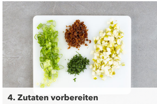
4. Zutaten vorbereiten

Ca. \frac{3}{4} der Gewürzmischung und die \frac{1}{2} des Brühgewürzes in das kochende Wasser geben, dann den Bulgur unterrühren und abgedeckt bei niedriger Hitze 8-10Min. sanft köcheln lassen, bis das Wasser aufgesaugt und der Bulgur gar ist. Noch ca. 5Min. ohne Hitzezufuhr ziehen lassen.