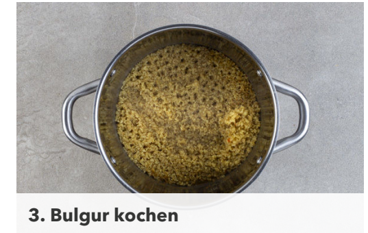
3. Bulgur kochen

Die Hähnchenteile in eine Auflaufform legen und im Ofen 30-40Min. backen, bis das Fleisch in der Mitte gar ist. Dabei die Hähnchenteile alle 10Min. wenden, damit sie von allen Seiten knusprig braun werden. Ca. 5Min. vor Ende der Garzeit 50ml Wasser angießen.