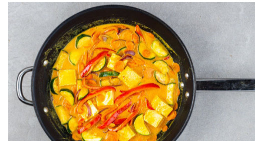
5. Curry fertigstellen

Die Zwiebeln in einer großen Pfanne mit 1TL Pflanzenöl und 1 Prise Salz bei mittlerer Hitze ca. 2Min. glasig anschwitzen. 1-2EL Currypaste unterrühren, dann die Zucchini , die Paprika und die Karotten zugeben und 1-2Min. mitbraten.