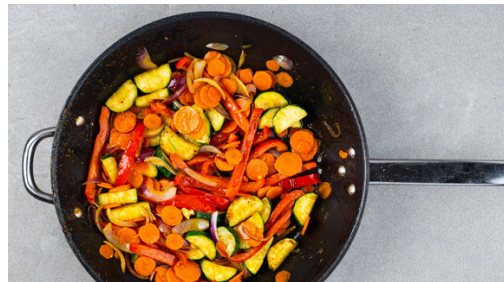
4. Gemüse braten

Die Zucchini längs halbieren und quer in breite Scheiben schneiden. Die Paprika vierteln, entkernen und in dünne Streifen schneiden. Die Zwiebel schälen, halbieren und in feine Streifen schneiden. Die Karotte ggf. schälen und in dünne Scheiben schneiden.