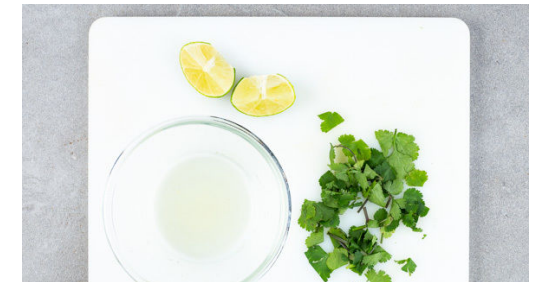
6. Garnitur vorbereiten

Das Gemüse mit der Kokosmilch und 50ml Wasser ablöschen, dann die Tofuwürfel und die ½ des Brühgewürzes unterrühren. Mit Pfeffer abschmecken. Das Curry einmal aufkochen lassen und anschließend auf niedrigster Stufe 5-10Min. sanft köcheln lassen, bis das Gemüse gar ist.