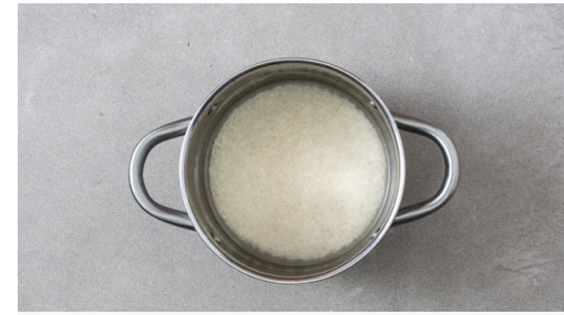
2. Reis kochen

In einem kleinen Topf 400ml leicht gesalzenes Wasser für den Reis zum Kochen bringen. Den Tofu in mundgerechte Würfel schneiden und mit 1TL Pflanzenöl sowie 1-2TL Currypaste vermengen. Bis zur weiteren Verwendung beiseitestellen.