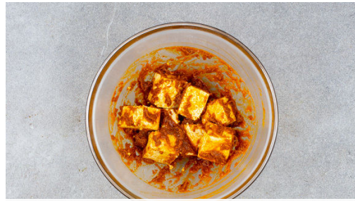
1. Tofu würzen

Energie 861kcal, Fett 33.4g, Kohlenhydrate 110.2g, Eiweiß 25.3g