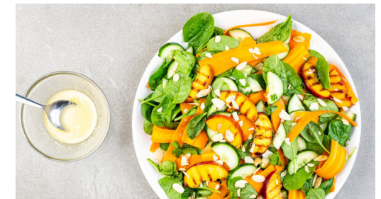
6. Salat vermengen

Die ½ des Ingwers oder mehr schälen und fein reiben, dann mit dem Sesamöl , 2EL Olivenöl, 1TL Honig und 1EL Essig zu einem Dressing verrühren.