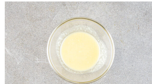
5. Dressing vorbereiten

Das Fleisch in der mittelgroßen Pfanne mit 1EL Olivenöl bei starker Hitze auf jeder Seite 2-3Min. braten, abhängig davon, ob es medium oder eher durchgebraten sein soll. Aus der Pfanne nehmen und bis zum Servieren auf einem Teller abgedeckt ruhen lassen.