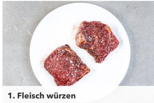
1. Fleisch würzen

Energie 585kcal, Fett 37.6g, Kohlenhydrate 28.3g, Eiweiß 35.5g