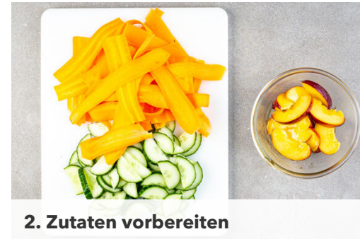
2. Zutaten vorbereiten

Das Fleisch trocken tupfen, mit der ½ der Gewürzmischung und 1 kräftigen Prise Salz einreiben und beiseitestellen. Tipp: Das Fleisch am besten 20-30Min. vor der Zubereitung aus dem Kühlschrank nehmen und Raumtemperatur annehmen lassen.