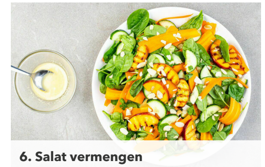
6. Salat vermengen

\frac{3}{4} des Ingwers oder mehr schälen und fein reiben, dann mit dem Sesamöl , 4EL Olivenöl, 1EL Honig und 2EL Essig zu einem Dressing verrühren.