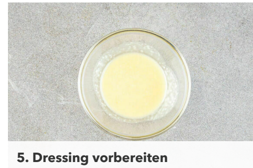
5. Dressing vorbereiten

Das Fleisch in der großen Pfanne mit 2EL Olivenöl bei starker Hitze auf jeder Seite 2-3Min. braten, abhängig davon, ob es medium oder eher durchgebraten sein soll. Aus der Pfanne nehmen und bis zum Servieren auf einem Teller abgedeckt ruhen lassen.