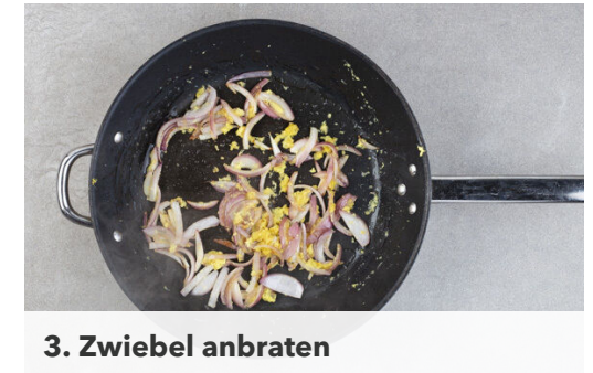
3. Zwiebel anbraten

Den Gemüsemix und die Orangenschale zum Hackfleisch in die Pfanne geben und alles 4-5Min. anbraten, bis das Gemüse gar ist. Dabei nach Bedarf etwas Wasser hinzugeben.