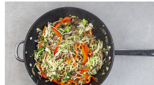
5. Gemüse garen

Den Reis in einem Sieb kalt abspülen, bis das Wasser klar bleibt. Sobald das Wasser kocht, den Reis hineingeben und abgedeckt bei niedrigster Hitze 10-12Min. kochen, bis das Wasser aufgesogen und der Reis gar ist. Noch ca. 5Min. ohne Hitzezufuhr ziehen lassen.