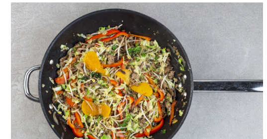
6. Verfeinern und servieren

Die Zwiebel schälen, halbieren und in feine Streifen schneiden. Den Knoblauch schälen und in feine Würfel schneiden. Die Zwiebel in einer großen Pfanne mit 1EL Pflanzenöl und 1 Prise Salz bei mittlerer Hitze 2-3Min. anbraten. Dann den Ingwer und den Knoblauch unterrühren und ca. 30Sek. mitbraten.