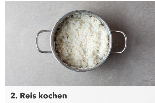
2. Reis kochen

Das Hackfleisch in die Pfanne geben und unter häufigem Rühren 2-3Min. krümelig braten. Das Fleisch soll noch nicht ganz durchgaren.