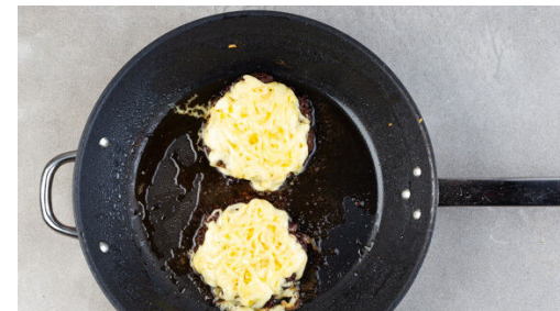
5. Käse schmelzen

Die Gurke mit einem Sparschäler der Länge nach in breite Streifen schneiden. Mit 2EL hellem Essig, ½TL Zucker und 1 Prise Salz vermengen und beiseitestellen.