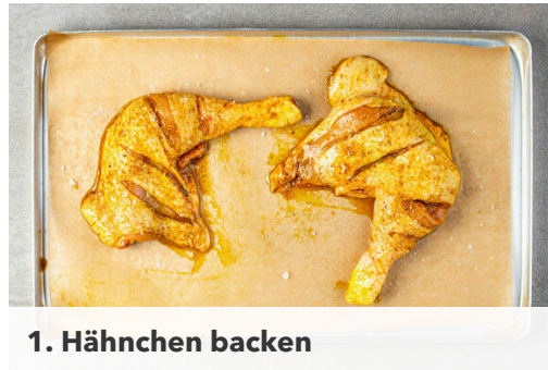
1. Hähnchen backen

Energie 676kcal, Fett 44.9g, Kohlenhydrate 20.9g, Eiweiß 44.4g