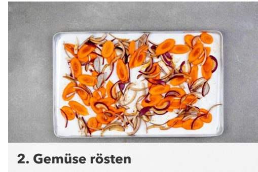
2. Gemüse rösten

Die Kokosraspel in einer kleinen Pfanne ohne Zugabe von Fett 1-2Min. leicht braun anrösten. Vorsicht , sie können schnell verbrennen. Zum Abkühlen aus der Pfanne nehmen.