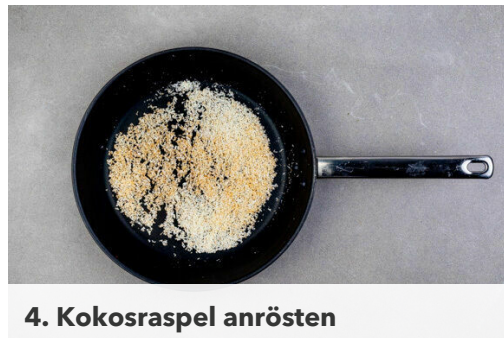
4. Kokosraspel anrösten

Den Backofen auf 250°C (230°C Umluft) vorheizen. Das Currypulver mit 2EL Pflanzenöl und ½TL Salz verrühren. Die Hähnchenschenkel trocken tupfen, 2-3-mal bis zu den Knochen einschneiden und mit dem Würzöl einreiben. Auf einem mit Backpapier ausgelegten Backblech 35-50Min. auf der untersten Schiene backen. Ggf. mit Alufolie abdecken, falls die Haut zu dunkel wird.