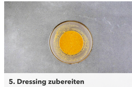
5. Dressing zubereiten

Die Karotten ggf. schälen und schräg in 0,5-1cm breite Scheiben schneiden. Die Zwiebeln schälen, halbieren und in feine Streifen schneiden. Die Karotten und die Zwiebeln mit 3-4EL Sojasauce vermengen und auf einem zweiten mit Backpapier ausgelegten Backblech 15-20Min. im Ofen rösten.