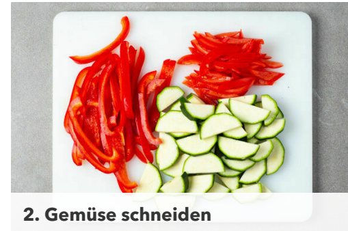
2. Gemüse schneiden

Die Zwiebeln schälen, halbieren und in feine Streifen schneiden. Den Knoblauch schälen und in feine Scheibchen schneiden.