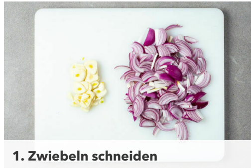
1. Zwiebeln schneiden

Energie 758kcal, Fett 57.8g, Kohlenhydrate 23.5g, Eiweiß 37.0g