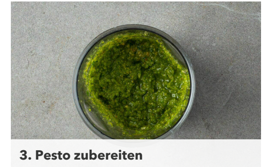
3. Pesto zubereiten

Die Zucchini längs halbieren und quer in dünne Scheiben schneiden. Die Paprika vierteln, entkernen und in dünne Streifen schneiden. Die Tomaten vierteln, dabei die Kerne entfernen und das Fruchtfleisch in dünne Streifen schneiden.