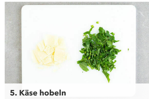
5. Käse hobeln

Die Bohnen mit 2EL Olivenöl und 1/2TL Salz vermengen und im Ofen 16-18Min. backen. Die Haselnüsse (am besten separat) und die Hähnchenstreifen ca. 3Min. vor Ende der Garzeit dazugeben und mitbacken. Anschließend die Nüsse grob hacken.