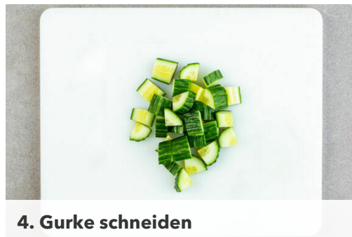
4. Gurke schneiden

Den Backofen auf 220°C (200°C Umluft) vorheizen. In einem Wasserkocher 600ml Wasser zum Kochen bringen. Den Knoblauch schälen und fein würfeln. Die Enden der Bohnen ggf. abschneiden. Die Zitronenschale von 1 Zitrone fein abreiben, dann beide Zitronen halbieren und auspressen.