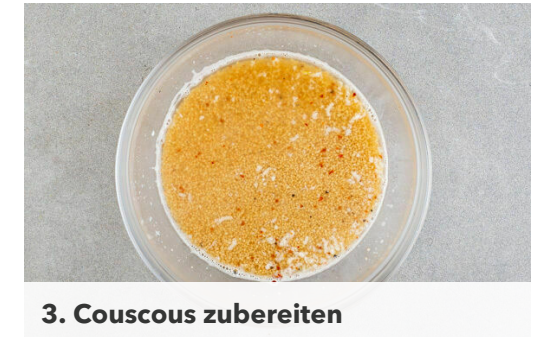
3. Couscous zubereiten

Den Käse mit einem Sparschäler oder Käsehobel in breite Streifen schneiden. Die Minzeblätter von den Stängeln zupfen und in grobe Streifen schneiden.