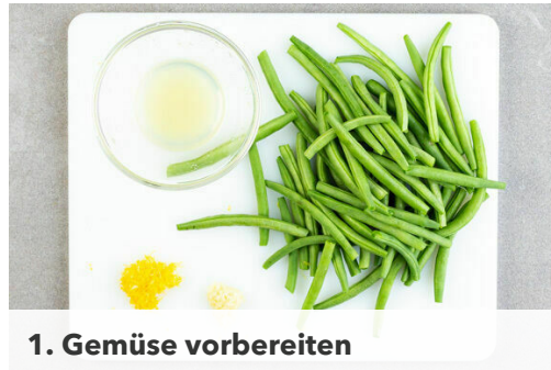
1. Gemüse vorbereiten

Energie 697kcal, Fett 35.8g, Kohlenhydrate 70.5g, Eiweiß 29.0g