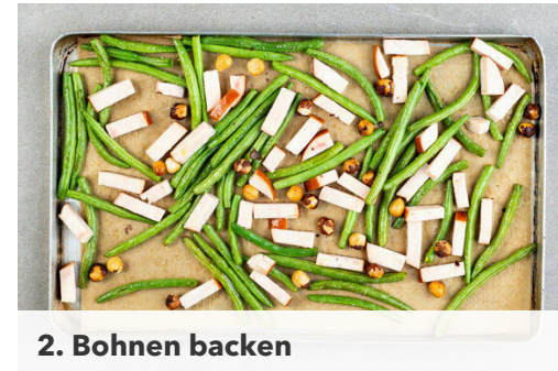
2. Bohnen backen

Die Gurke in 1-2cm große Würfel schneiden.