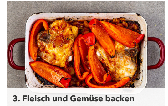
3. Fleisch und Gemüse backen

Das Fleisch nach ca. 15Min. Backzeit wenden, die Bohnen unter das Gemüse in der Auflaufform mengen und nach Belieben mit mehr Salz und Pfeffer würzen. Alles zusammen ca. 15Min. im Ofen weiterbacken, bis das Fleisch goldbraun und gar ist.