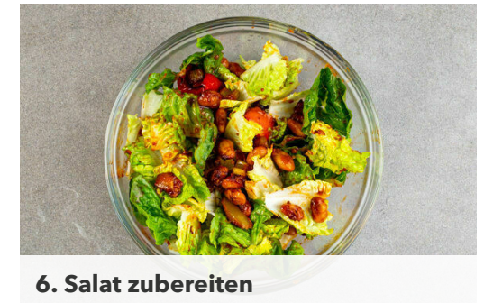
6. Salat zubereiten

Das Fleisch trocken tupfen, mit der Paprika und dem Sellerie in die Auflaufform geben und gut mit der Würzpaste vermengen. Das Gemüse und das Fleisch mit der Hautseite nach unten im Ofen ca. 15Min. backen.