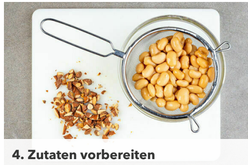
4. Zutaten vorbereiten

Den Backofen auf 220°C (200°C Umluft) vorheizen. Den Knoblauch schälen und fein würfeln. Den Sellerie in dünne Scheiben schneiden. Die Paprika achteln, dabei die Kerne entfernen.