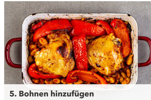
5. Bohnen hinzufügen

Das Paprikapulver , den Knoblauch und das Tomatenmark in einer großen Auflaufform mit 4EL Olivenöl, 4EL Essig, 1TL Salz, 1 kräftigen Prise Zucker sowie Pfeffer nach Geschmack verrühren. Tipp: Wer keine große Auflaufform hat, kann auch ein Backblech verwenden.