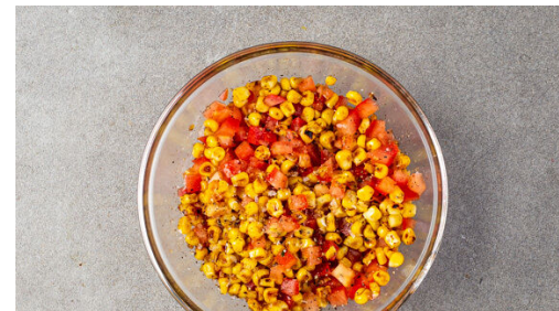
5. Salat zubereiten

Die Limettenschale abreiben und den Koriander samt Stängeln fein schneiden. Die Zwiebel schälen, halbieren und fein würfeln. Alles zu einem Topping vermengen.