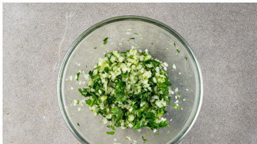
4. Topping zubereiten

Die Hüllblätter und Fäden entfernen und die Maiskörner mit einem scharfen Messer vom Kolben schneiden, mit 1EL Pflanzenöl sowie je 1 Prise Salz und Pfeffer vermengen. Den Mais in einer Grillpfanne oder einer normalen Pfanne ohne Zugabe von Fett bei starker Hitze 4-6Min. grillen, bis Röstspuren zu sehen sind. Den Mais aus der Pfanne nehmen und beiseitestellen.