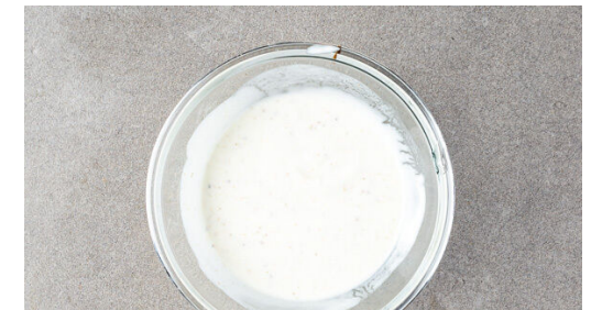
6. Dip anrühren

Die Limette halbieren und auspressen. Die Tomate in kleine Würfel schneiden. Den Mais und die Tomatenn mit 1EL Limettensaft , ½EL hellem Essig sowie je 1 Prise Salz und Pfeffer zu einem Salat vermengen.