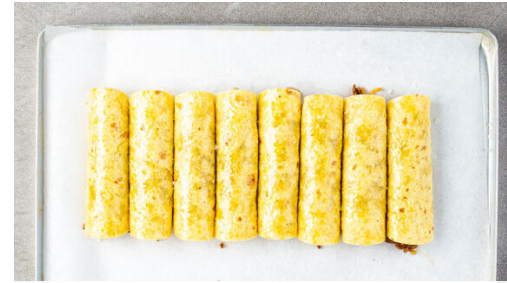
2. Taquitos backen

Den Backofen auf 220°C (200°C Umluft) vorheizen. Den Knoblauch schälen und fein würfeln. Das Hackfleisch mit dem Knoblauch , dem Paprikapulver , 1TL Kreuzkümmel und je ½TL Salz und Pfeffer in einer mittelgroßen Pfanne mit 1EL Pflanzenöl bei starker Hitze 2-3Min. scharf anbraten.