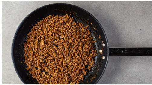
1. Hackfleisch anbraten

Energie 982kcal, Fett 52.9g, Kohlenhydrate 88.5g, Eiweiß 42.5g