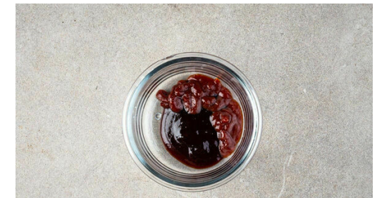
6. Belegen und servieren

Das Fleisch trocken tupfen und jeweils horizontal zu 2 dünneren Filets halbieren. 2EL Olivenöl, 2EL hellen Essig, die 1/2 der BBQ-Sauce sowie je 1 Prise Salz und Pfeffer zu einer Würzsauce vermengen und das Fleisch damit einreiben.