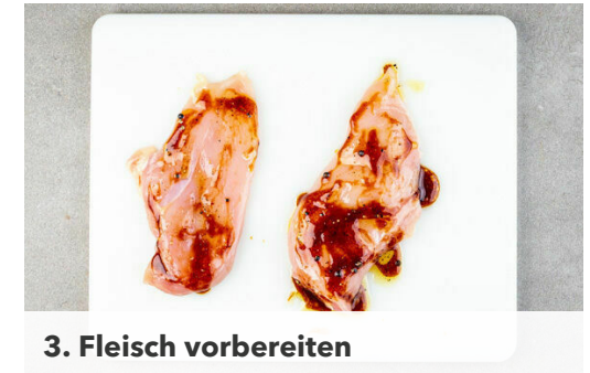
3. Fleisch vorbereiten

Die Burgerbrötchen halbieren und auf einem Backrost 2-3Min. aufbacken. Den Schnittlauch in feine Röllchen schneiden und mit dem Joghurt , dem Knoblauch sowie je 1 Prise Salz und Pfeffer vermengen. Den Salat in mundgerechte Streifen schneiden, dabei den Strunk entfernen.