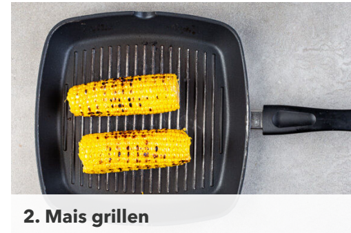
2. Mais grillen

Die Grillpfanne ohne Zugabe von Fett mittelhoch erhitzen, das Fleisch in die heiße Pfanne geben und auf jeder Seite 3-4Min. grillen. Die Zwiebelringe 4-5Min. mitgrillen, bis sie weich sind, dabei gelegentlich wenden. Das Fleisch und die Zwiebeln auf einem Teller beiseitestellen.