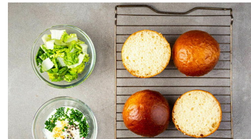
5. Brötchen aufbacken

Eine Grillpfanne ohne Zugabe von Fett hoch erhitzen. Die Maiskolben in die heiße Pfanne legen, mit je 1 Prise Salz und Pfeffer würzen und ca. 5Min. grillen, bis der Mais stellenweise gebräunt ist, dabei gelegentlich wenden. Den Mais aus der Pfanne nehmen, auf einem Teller etwas abkühlen lassen, dann mit einem scharfen Messer vom Kolben schneiden. Die Pfanne aufbewahren.