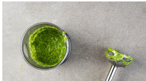
4. Dressing zubereiten

Die Chorizo in einer mittelgroßen Pfanne mit 1TL Olivenöl bei mittlerer Hitze in 4-5Min. knusprig braten, dabei gelegentlich umrühren. Anschließend die Chorizo mit einer Schaumkelle aus der Pfanne nehmen und beiseitestellen. Die Pfanne nicht auswischen.