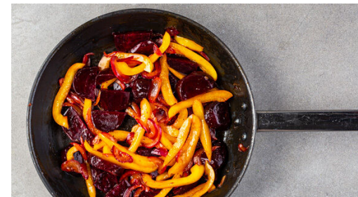
5. Gemüse braten

Die Paprika vierteln, entkernen und in dünne Streifen schneiden. Die Zwiebel schälen, halbieren und in feine Streifen schneiden. Die Rote Bete halbieren und in dünne Scheiben schneiden. Tipp: Da Rote Bete stark färbt, beim Verarbeiten am besten Küchenhandschuhe und Schürze tragen. Die Orangenschale abreiben, dann die Orange halbieren und auspressen.