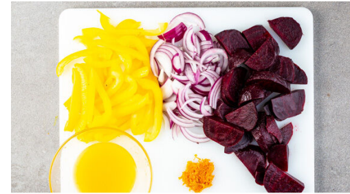
2. Zutaten vorbereiten

Das Basilikum samt Stängeln grob schneiden. Den Feta halbieren und eine Hälfte für ein anderes Rezept aufbewahren. Das Basilikum mit der ½ der Pistazien , der ½ des übrigen Fetas , der Orangenschale , dem restlichen Orangensaft und 2EL Olivenöl in einem hohen Gefäß mit einem Stabmixer zu einem glatten Dressing pürieren.