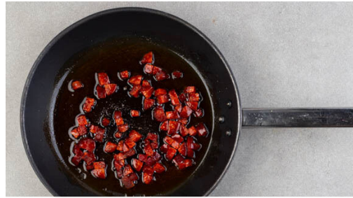
1. Chorizo braten

Energie 698kcal, Fett 50.2g, Kohlenhydrate 32.5g, Eiweiß 26.3g