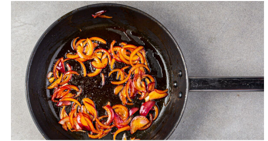
3. Zwiebeln braten

Die Paprika und die Rote Bete zu den Zwiebeln in die Pfanne geben und 2-3Min. mitbraten, bis das Gemüse warm und die Flüssigkeit größtenteils verdampft ist. Mit Salz und Pfeffer abschmecken.