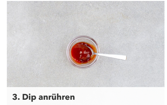
3. Dip anrühren

Die Tonkatsu in einer mittelgroßen Pfanne mit 2EL Pflanzenöl bei mittlerer bis starker Hitze auf jeder Seite 2-3Min. knusprig braten.