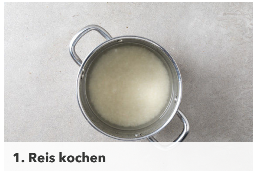
1. Reis kochen

Energie 942kcal, Fett 32.6g, Kohlenhydrate 115.5g, Eiweiß 40.1g