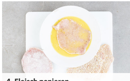
4. Fleisch panieren

In einem kleinen Topf 300ml leicht gesalzenes Wasser zum Kochen bringen. Den Reis in einem Sieb kalt abspülen, bis das Wasser klar bleibt. Sobald das Wasser kocht, den Reis hineingeben und abgedeckt bei niedrigster Hitze 18-20Min. kochen, bis das Wasser aufgesogen und der Reis gar ist. Noch ca. 5Min. ohne Hitzezufuhr ziehen lassen.