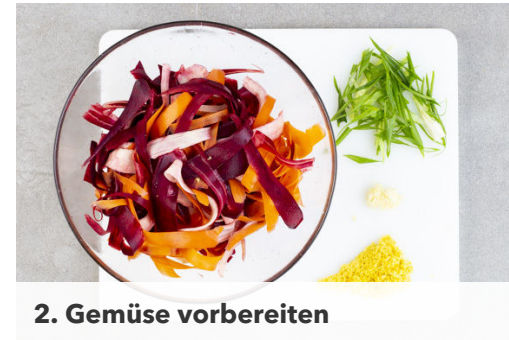
2. Gemüse vorbereiten

1 Ei auf einem tiefen Teller verquirlen. Auf einem zweiten Teller 3EL Mehl, auf einem dritten Teller das Panko-Paniermehl bereitstellen. Das Fleisch trocken tupfen, mit einem Fleischklopfer oder einer schweren Pfanne ca. 0,5cm dünn plattieren und halbieren. Mit Salz und Pfeffer würzen und nacheinander im Mehl, dem verquirlten Ei und dem Panko-Paniermehl wenden.