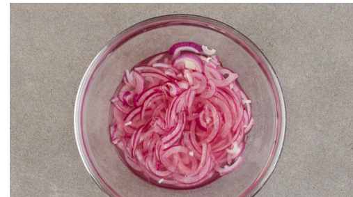
5. Zwiebeln einlegen

Den Fenchel längs vierteln, dann jeweils quer in feine Streifen schneiden, dabei den Strunk entfernen. Ggf. vorhandenes Fenchelgrün beiseitelegen. Die Karotte ggf. schälen, längs halbieren und quer in dünne Scheiben schneiden.