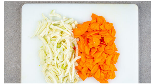
2. Gemüse schneiden

Das Wasser bei mittlerer bis starker Hitze aufkochen, dann bei niedriger Hitze abgedeckt 10-12Min. köcheln lassen, bis der Bulgur gar ist. Inzwischen die Oliven grob schneiden, mit der Orangenschale vermengen und in den Topf einrühren. Alles ohne Deckel bei mittlerer bis niedriger Hitze weitere 5-7Min. köcheln lassen, bis das Fleisch gar ist.