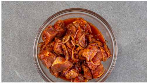
1. Fleisch würzen

Energie 791kcal, Fett 30.2g, Kohlenhydrate 80.0g, Eiweiß 40.9g