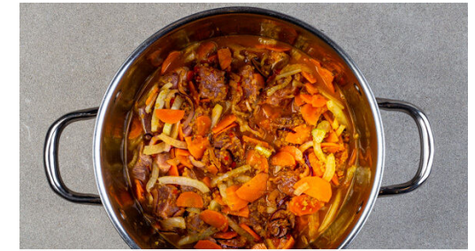
3. Gemüse garen

1EL Zucker, 1TL Salz und 80ml Essig verrühren, bis sich Salz und Zucker auflösen. Die restlichen Zwiebeln untermengen und beiseitestellen.