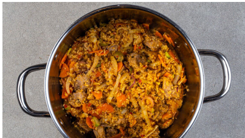
4. Bulgur und Fleisch garen

Die Orangenschale abreiben, dann die Orange halbieren und auspressen. Den Knoblauch schälen und fein würfeln. Die Zwiebel schälen, halbieren und in feine Streifen schneiden. Das Fleisch trocken tupfen, in 2-3cm große Stücke schneiden und mit dem Orangensaft , dem Knoblauch , der Tajine-Paste , der 1/2 der Zwiebeln , 1/2TL Salz und 1 Prise Pfeffer vermengen.