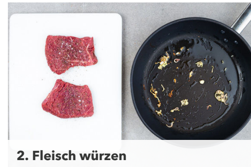
2. Fleisch würzen

Das Fleisch in der Pfanne mit dem Zitronengrasöl bei starker Hitze auf jeder Seite 2-4Min. scharf anbraten, je nach Dicke des Fleisches . Die Hitze reduzieren und das Fleisch noch 1-3Min. abgedeckt garen, je nachdem, ob es medium oder durch sein soll. Das Fleisch abgedeckt auf einem Teller ruhen lassen.