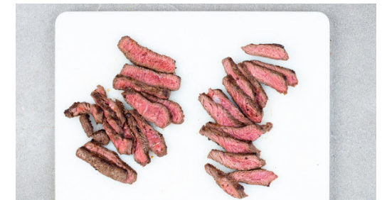
6. Fleisch schneiden

Die Tomate grob würfeln, dabei den Strunk entfernen. Die Gurke längs halbieren und quer in dünne Scheiben schneiden. Die Zwiebel schälen, halbieren und in feine Streifen schneiden. Die Kräuter samt Stängeln fein schneiden. Die 1/2 der Kräuter mit den Tomaten , den Gurken und dem Feldsalat vermengen.