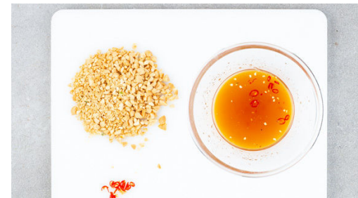
5. Dressing zubereiten

Das Fleisch trocken tupfen, horizontal halbieren und mit Salz und Pfeffer würzen. Die äußeren Schichten des Zitronengrases entfernen, das untere Drittel in feine Scheiben schneiden und in einer mittelgroßen Pfanne mit 2EL Olivenöl bei mittlerer Hitze 2-3Min. knusprig frittieren. Auf einem Teller beiseitelegen, das Öl in der Pfanne lassen.