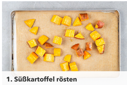
1. Süßkartoffel rösten

Energie 579kcal, Fett 29.4g, Kohlenhydrate 43.9g, Eiweiß 34.5g