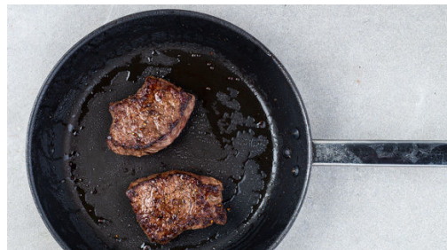
4. Fleisch braten

Den Backofen auf 240°C (220°C Umluft) vorheizen. Die Süßkartoffel samt Schale in ca. 2cm große Würfel schneiden, auf einem mit Backpapier ausgelegten Backblech mit 1EL Olivenöl sowie Salz vermengen und 15-20Min. im Ofen goldbraun rösten.