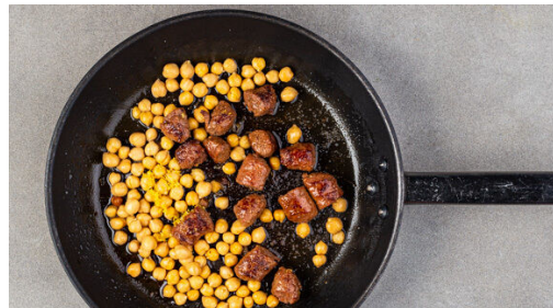
4. Kichererbsen mitbraten

Die Würste von der Pelle befreien, in mundgerechte Stücke schneiden und in einer großen Pfanne mit 1EL Olivenöl bei mittlerer bis starker Hitze in 3-5Min. goldbraun braten, dabei gelegentlich umrühren.