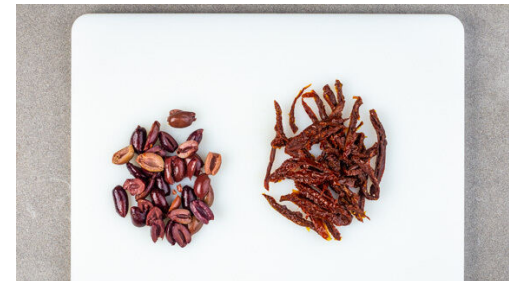
5. Topping vorbereiten

Die Kichererbsen zu der Wurst in die Pfanne geben und 2-3Min. mitbraten, dann mit der Zitronenschale , dem restlichen Zitronensaft und je 1 Prise Salz und Pfeffer würzen.