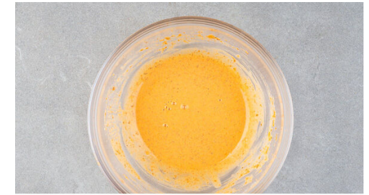
3. Teig verrühren

Eine mittelgroße Pfanne ca. 1cm hoch mit Pflanzenöl befüllen und dieses bei mittlerer bis starker Hitze erwärmen. Die ½ des Fleisches in das heiße Öl geben und 3-4Min. goldbraun frittieren, dabei gelegentlich wenden. Die Hitze reduzieren, falls das Öl zu heiß wird. Auf etwas Küchentrepp abtropfen lassen und das restliche Fleisch in der gleichen Weise zubereiten.