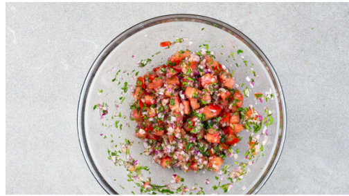
1. Pico de gallo zubereiten

Energie 1123kcal, Fett 56.0g, Kohlenhydrate 117.0g, Eiweiß 41.5g