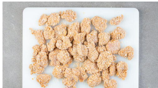
4. Fleisch panieren

Die Tomate in kleine Würfel schneiden. Die Zwiebel und den Knoblauch schälen und sehr fein würfeln. Die Limettenschale abreiben, dann die Limette auspressen. Den Koriander samt Stängeln fein schneiden. Die Tomatenwürfel , die Zwiebeln , die ½ des Knoblauchs , die ½ des Limettensafts und ¾ des Korianders vermengen und mit Salz und Pfeffer abschmecken.