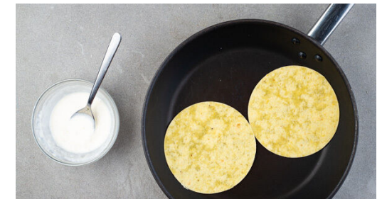
6. Tortillas erwärmen

Die Gewürzmischung mit 40g Mehl, 50ml Wasser und je 1 kräftigen Prise Salz und Pfeffer zu einem zähflüssigen Teig verrühren. Ggf. etwas Wasser hinzufügen, falls der Teig zu dickflüssig ist. Tipp: Wer es nicht so scharf mag, kann weniger Gewürzmischung verwenden.