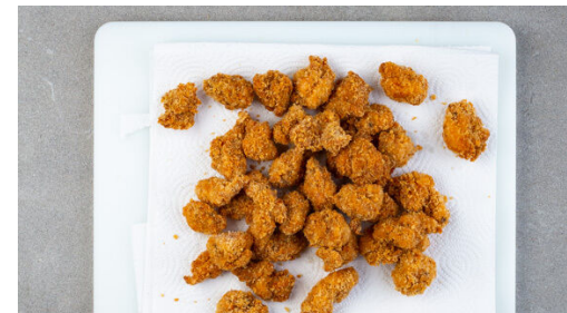
5. Fleisch frittieren

Die Paprika vierteln, entkernen und in 1-2cm große Würfel schneiden. Die Karotte ggf. schälen und grob raspeln. Das Gemüse mit der Limettenschale , dem restlichen Limettensaft , ½TL Kreuzkümmel und je 1 Prise Salz und Pfeffer zu einem Salat vermengen. Nach Geschmack mit etwas mehr Kreuzkümmel sowie Salz und Pfeffer verfeinern.