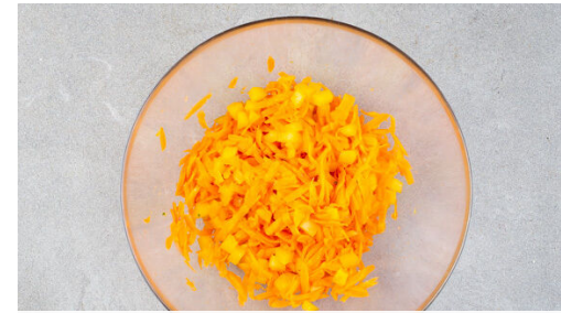
2. Salat zubereiten

Das Fleisch trocken tupfen und in ca. 2cm große Würfel schneiden, dann mit 1EL Mehl und je 1 Prise Salz und Pfeffer vermengen, durch den Teig ziehen und in das Panko-Paniermehl legen. Die Fleischstücke in der Panade rollen und dabei leicht andrücken, bis sie rundum bedeckt sind.