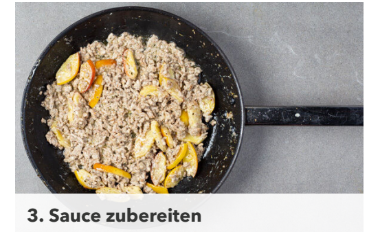
3. Sauce zubereiten

Die Gurke längs vierteln und in breite Stücke schneiden. Je nach Geschmack ca. die 1/2 des Mohns mit 2TL Olivenöl, 2TL Essig und je 1 Prise Salz und Pfeffer verrühren und die Gurken mit dem Dressing vermengen.