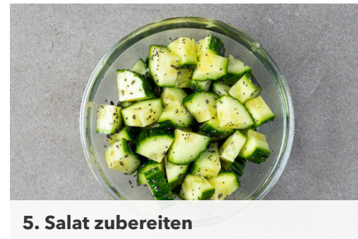
5. Salat zubereiten

Die Apfelscheiben in einer mittelgroßen Pfanne mit 1EL Olivenöl bei mittlerer Hitze unter gelegentlichem Rühren ca. 4Min. anbraten. Aus der Pfanne nehmen und beiseitestellen.