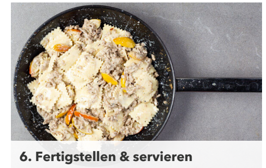
6. Fertigstellen & servieren

In der Pfanne erneut 1EL Olivenöl erhitzen und den Knoblauch und das Hackfleisch mit der 1/2 der Gewürzmischung und 1 Prise Salz bei mittlerer bis starker Hitze 4-5Min. goldbraun anbraten. Die Crème fraîche unterrühren, die Äpfel dazugeben und 30Sek.-1Min. erwärmen. Die Pfanne mit der Sauce vom Herd nehmen und beiseitestellen.