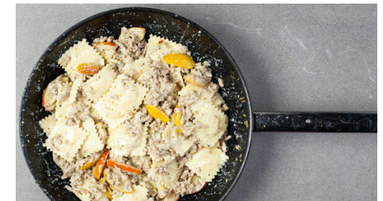
6. Fertigstellen & servieren

In der Pfanne erneut 1EL Olivenöl erhitzen und den Knoblauch und das Hackfleisch mit der Gewürzmischung und 1 kräftigen Prise Salz bei mittlerer bis starker Hitze 4-5Min. goldbraun anbraten. Die Crème fraîche unterrühren, die Äpfel dazugeben und 30Sek.-1Min. erwärmen. Die Pfanne mit der Sauce vom Herd nehmen und beiseitestellen.