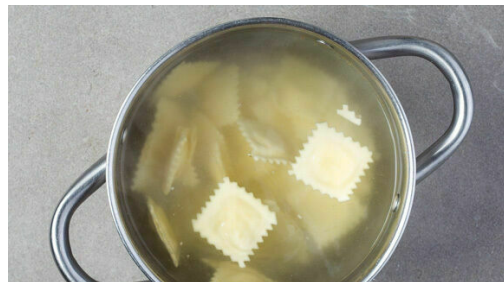
4. Ravioli kochen

In einem großen Topf ausreichend gesalzenes Wasser für die Pasta zum Kochen bringen. Die Äpfel vierteln, entkernen und quer in dünne Scheiben schneiden. Den Knoblauch schälen und fein würfeln. Den Käse grob reiben.