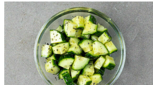
5. Salat zubereiten

Die Apfelscheiben in einer großen Pfanne mit 1EL Olivenöl bei mittlerer Hitze unter gelegentlichem Rühren ca. 4Min. anbraten. Aus der Pfanne nehmen und beiseitestellen.