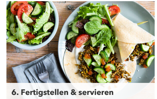
6. Fertigstellen & servieren

Das Hackfleisch sowie je 1 kräftige Prise Salz und Pfeffer hinzufügen und bei starker Hitze ca. 5Min. unter gelegentlichem Rühren braun braten. Das restliche Aprikosenchutney und die getrockneten Aprikosen hinzugeben, ca. 2Min. weiter braten und nach Geschmack mit Salz und Pfeffer würzen.