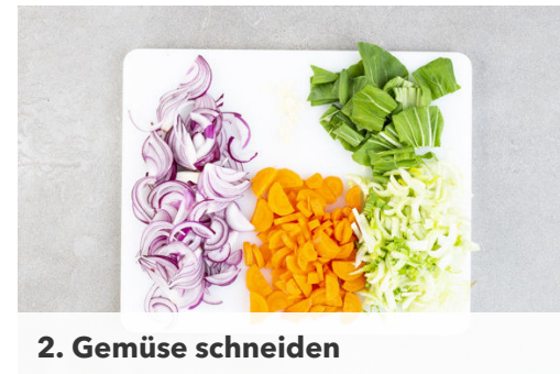
2. Gemüse schneiden

In einem großen Topf ausreichend gesalzenes Wasser für die Nudeln zum Kochen bringen. Die Limettenschale fein abreiben, dann die Limette halbieren und auspressen.