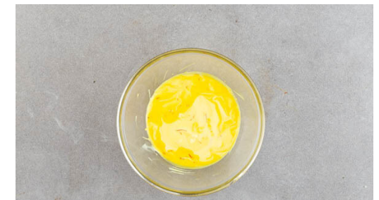
6. Joghurt würzen

Den Blumenkohl in mundgerechte Röschen schneiden und auf einem mit Backpapier ausgelegten Backblech mit der Gewürzmischung , 2EL Olivenöl und ½TL Salz vermengen. Im oberen Teil des Backofens 15-20Min. backen, bis der Blumenkohl appetitlich gebräunt ist. Zum Abkühlen aus dem Ofen nehmen.