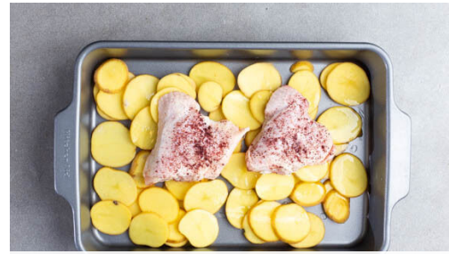
2. Zutaten backen

Die Pistazien in einer mittelgroßen Pfanne ohne Zugabe von Fett bei mittlerer Hitze 2-3Min. goldbraun anrösten, dann grob hacken. Den Dill von den harten Stängeln zupfen und grob schneiden. Die Weintrauben ebenfalls abzupfen und ggf. halbieren. Die Pistazien , den Dill und die Weintrauben mit 2EL Essig und je ½TL Salz, Pfeffer und Zucker vermengen.