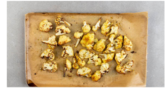
3. Blumenkohl backen

Die gebackenen Kartoffelscheiben zum Abkühlen auf das Backblech zu dem Blumenkohl geben, dann das Fleisch mit der Hautseite nach oben zurück in die Auflaufform geben. Die Temperatur im Backofen auf 240°C erhöhen und, falls vorhanden, die Grillfunktion einschalten. Das Fleisch im Ofen 5-10Min. weiterbacken, bis es knusprig ist.