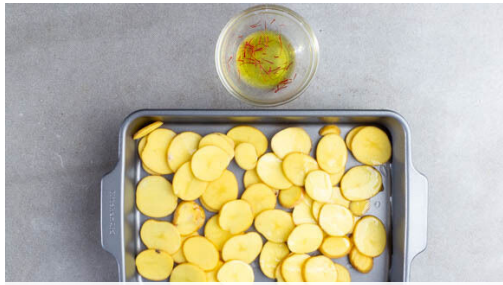
1. Zutaten vorbereiten

Energie 863kcal, Fett 45.6g, Kohlenhydrate 71.2g, Eiweiß 39.3g