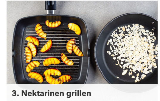
3. Nektarinen grillen

Die Karotte ggf. schälen und mit einem Sparschäler in dünne, breite Streifen schneiden. Die Gurke längs halbieren und quer in dünne Scheiben schneiden. Die Nektarine halbieren und in 8 Spalten schneiden, dabei den Stein entfernen. Die Nektarinenspalten mit 1TL Honig und 1TL Olivenöl vermengen.