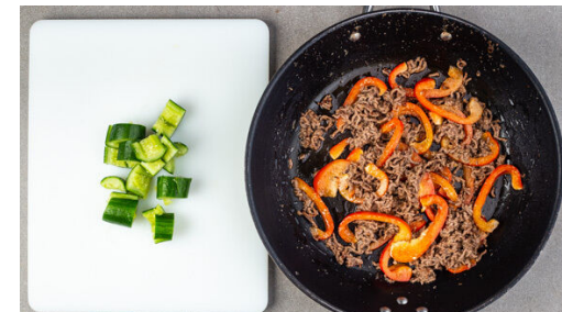
3. Paprika braten

Die Erdnüsse , die übrige Tamarindenpaste , 1TL Zucker, 1EL Pflanzenöl und 2-3EL Wasser in dem hohen Gefäß cremig pürieren, dabei ggf. etwas Wasser hinzufügen, falls die Sauce zu dickflüssig ist. Nach Geschmack mit Salz, Pfeffer und Zucker verfeinern.