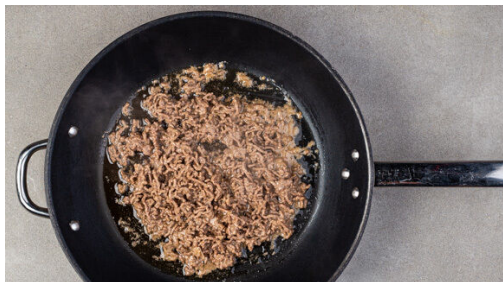
4. Garnelen mitbraten

In einem kleinen Topf 400ml leicht gesalzenes Wasser zum Kochen bringen. Den Reis in einem Sieb kalt abspülen, bis das Wasser klar bleibt. Sobald das Wasser kocht, den Reis hineingeben und abgedeckt bei niedrigster Hitze 10-12Min. kochen, bis das Wasser aufgesogen und der Reis gar ist. Noch ca. 5Min. ohne Hitzezufuhr ziehen lassen.