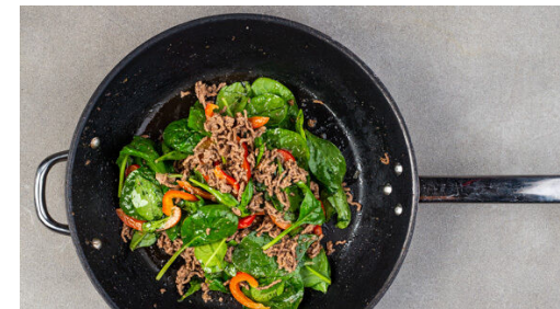
6. Spinat garen

Die Paprika vierteln, entkernen und in dünne Streifen schneiden. Die Würzsauce in einer großen Pfanne mit 1EL Pflanzenöl bei mittlerer bis starker Hitze ca. 1Min. anbraten, dann die Paprika zugeben und in 5-6Min. weich braten. Die Gurke mit einer schweren Pfanne oder einem Nudelholz so lange schlagen, bis sie auf- bzw. in Stücke bricht, dann in mundgerechte Stücke schneiden.