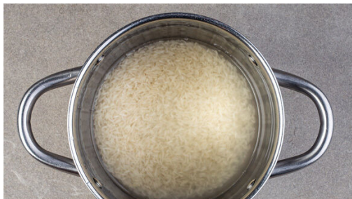
1. Reis kochen

Energie 858kcal, Fett 39.4g, Kohlenhydrate 100.0g, Eiweiß 26.8g