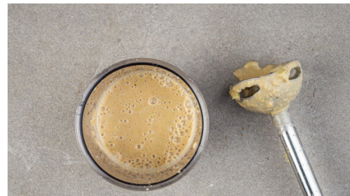
2. Würzsauce pürieren

Die Garnelen in einem Sieb kalt abspülen und abtropfen lassen. Wenn die Paprika weich ist, die Garnelen hinzufügen und 2-3Min. mitbraten, bis sie gar sind.