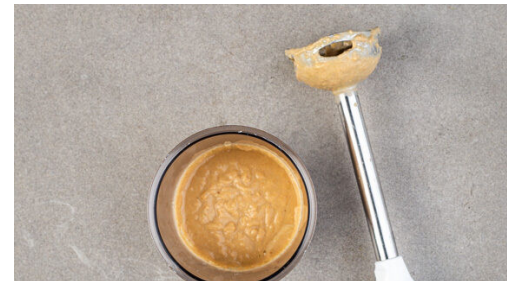
5. Sauce pürieren

Die Paprika vierteln, entkernen und in dünne Streifen schneiden, dann zu dem Hackfleisch in die Pfanne geben und in 3-4Min. weich braten. Die Gurke auf ein Brett legen und mit einer schweren Pfanne oder einem Nudelholz so lange schlagen, bis die Gurke auf- bzw. in Stücke bricht, dann grob in mundgerechte Stücke schneiden.