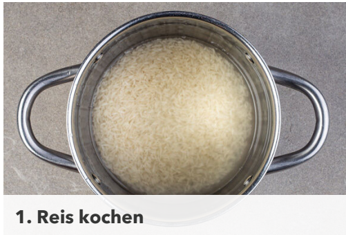
1. Reis kochen

Energie 1080kcal, Fett 59.5g, Kohlenhydrate 100.3g, Eiweiß 36.3g