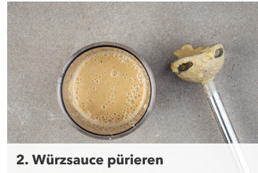
2. Würzsauce pürieren

In einem kleinen Topf 400ml leicht gesalzenes Wasser zum Kochen bringen. Den Reis in einem Sieb kalt abspülen, bis das Wasser klar bleibt. Sobald das Wasser kocht, den Reis hineingeben und abgedeckt bei niedrigster Hitze 10-12Min. kochen, bis das Wasser aufgesogen und der Reis gar ist. Noch ca. 5Min. ohne Hitzezufuhr ziehen lassen.