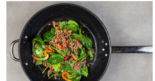
6. Spinat garen

Die Erdnüsse , die übrige Tamarindenpaste , 1TL Zucker, 1EL Pflanzenöl und 2-3EL Wasser in dem hohen Gefäß cremig pürieren und ggf. etwas Wasser hinzufügen, falls die Sauce zu dickflüssig ist. Nach Geschmack mit Salz, Pfeffer und Zucker verfeinern.