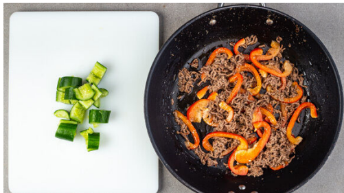
4. Gemüse zubereiten

Die Würzsauce in einer großen Pfanne mit 1EL Pflanzenöl bei mittlerer bis starker Hitze ca. 1Min. anbraten, dann das Hackfleisch zugeben und unter stetigem Rühren in 6-8Min. goldbraun und gar braten. Das hohe Gefäß aufbewahren.