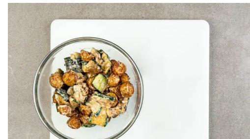
5. Kartoffelsalat zubereiten

Die Zucchini längs halbieren und in ca. 1cm dünne Scheiben schneiden, dann in einer Grillpfanne oder normalen Pfanne bei mittlerer bis starker Hitze 2-3Min. auf jeder Seite braten. Währenddessen jede Seite mit je 1 Prise Salz würzen. Die Zuchinischeiben aus der Pfanne nehmen, mit 2EL Olivenöl vermengen und in ca. 2cm große Stücke schneiden. Die Pfanne aufbewahren.