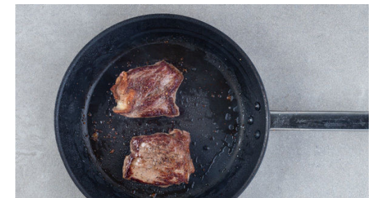
6. Fleisch braten

Die Kartoffeln und den Knoblauch aus dem Ofen nehmen. Den Knoblauch schälen und mit einer Gabel zerdrücken, dann mit 4EL Mayonnaise verrühren. Die Knoblauchsauce mit den Kartoffeln und der Zucchini vermengen. Das Fleisch trocken tupfen, von beiden Seiten mit insgesamt 1EL Olivenöl einreiben und mit je 1 Prise Salz und Pfeffer würzen.