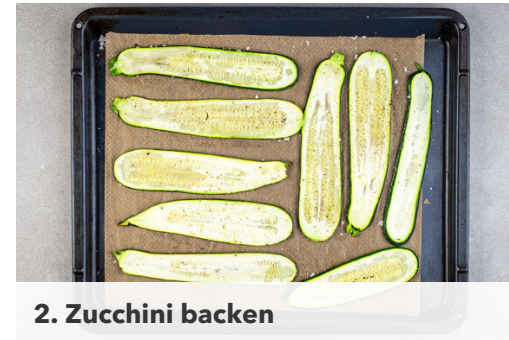
2. Zucchini backen

Den Schinken auf einem zweiten mit Backpapier ausgelegten Backblech verteilen und in 6-8Min. im Ofen goldbraun backen, dabei nach der Hälfte der Zeit das Blech um 180° drehen. Tipp: Den Schinken erst kurz vor dem Backen aus dem Kühlschrank nehmen, er lässt sich im kalten Zustand leichter ausbreiten.