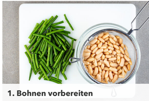
1. Bohnen vorbereiten

Energie 493kcal, Fett 31.5g, Kohlenhydrate 23.8g, Eiweiß 26.4g