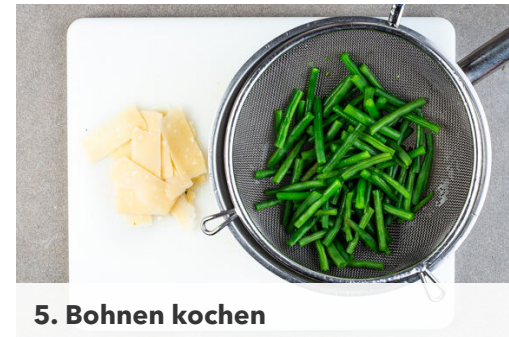
5. Bohnen kochen

Die Zucchini in ca. 0,5cm dicke Scheiben schneiden. Die Zuchinischeiben mit 2EL Olivenöl bepinseln und dann mit 1TL Salz und 1 kräftigen Prise Pfeffer würzen. Auf einem mit Backpapier ausgelegten Backblech 10-15Min. im Ofen goldbraun backen.