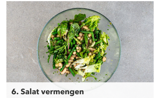
6. Salat vermengen

Die Kapern und die Petersilie samt Stängeln fein schneiden. Die Kapern und 3/4 der Petersilie mit 4EL Olivenöl, 2EL Essig, 2TL Senf, 2TL Honig und je 1 kräftigen Prise Salz und Pfeffer zu einem Dressing verrühren.