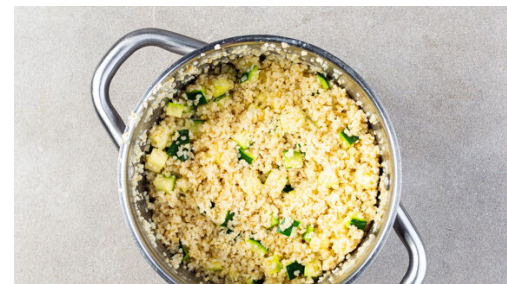
5. Dressing untermengen

Den Bulgur in das kochende Wasser geben und abgedeckt ca. 6Min. kochen. Die Zucchini in ca. 1cm kleine Würfel schneiden, nach 6Min. Kochzeit zum Bulgur in den Topf geben und den Bulgur und die Zucchini noch 2-4Min. kochen lassen, bis der Bulgur bissfest ist.