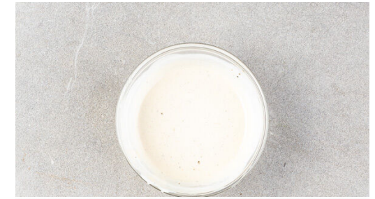
3. Dressing zubereiten

Den Bulgur und die Zucchini in ein Sieb abgießen und abtropfen lassen. Zurück in den Topf geben und die ½ des Dressings untermengen.