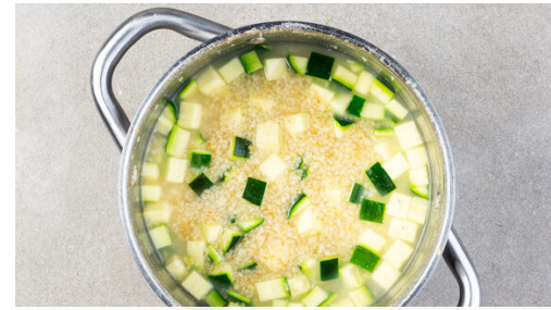
2. Bulgur kochen

Das Fleisch in einer großen Pfanne bei mittlerer Hitze auf jeder Seite ca. 2Min. anbraten, bis es appetitlich gebräunt und gar ist.