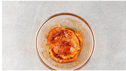
1. Fleisch würzen

Energie 751kcal, Fett 31.2g, Kohlenhydrate 69.0g, Eiweiß 45.6g