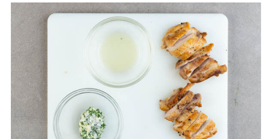
6. Würzbutter zubereiten

In einem mittelgroßen Topf 1,2L Wasser mit der ½ des Brühwürzes verrühren und zum Kochen bringen. Die restlichen Austernpilze grob zerkleinern. Den Lauch längs halbieren und quer in dünne Streifen schneiden. Den Knoblauch schälen und fein würfeln.