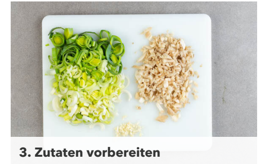
3. Zutaten vorbereiten

Den Perlencouscous nach und nach mit der Brühe ablöschen, dabei gelegentlich umrühren. Diesen Vorgang 8-10Min. lang wiederholen, bis die Brühe aufgebraucht und der Perlencouscous gar ist. Die Gewürzmischung einrühren und den Spinat unterheben, bis er zusammengefallen ist. Mit mehr Brühwürz oder Salz und Pfeffer abschmecken.