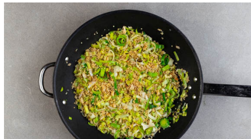
4. Gemüse anbraten

Den Backofen auf 240°C (220°C Umluft) vorheizen. 3EL Butter Raumtemperatur annehmen lassen. Das Fleisch trocken tupfen und mit je 1 Prise Salz und Pfeffer würzen. In einer großen Pfanne mit 2EL Olivenöl bei starker Hitze 1-2Min. auf jeder Seite goldbraun anbraten, herausnehmen und auf ein mit Backpapier ausgelegtes Backblech geben. Die Pfanne samt Bratenfett aufbewahren.