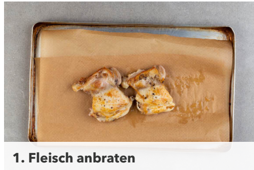
1. Fleisch anbraten

Energie 920kcal, Fett 44.5g, Kohlenhydrate 90.8g, Eiweiß 44.6g