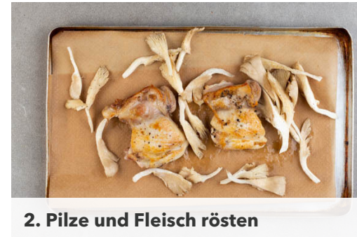
2. Pilze und Fleisch rösten

Die Austernpilze , den Lauch und den Knoblauch in der großen Pfanne bei mittlerer Hitze 2-3Min. anbraten, dann den Perlencouscous einrühren und 1-2Min. mitbraten.