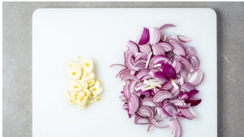
1. Zwiebeln schneiden

Energie 662kcal, Fett 47.4g, Kohlenhydrate 24.2g, Eiweiß 35.5g