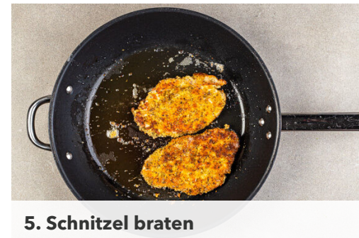
5. Schnitzel braten

Den Brokkoli in mundgerechte Röschen schneiden, auf einem mit Backpapier ausgelegten Backblech mit 1EL Olivenöl und je 1 Prise Salz und Pfeffer vermengen und 10-15Min. im Ofen rösten, bis der Brokkoli leicht gebräunt und gar ist.