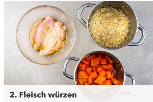
2. Fleisch würzen

Mit einer Tasse etwas Kochwasser abschöpfen, dann die Karotten in ein Sieb abgießen und abtropfen lassen. Die Karotten zurück in den Topf geben und mit dem Zwiebel-Walnuss-Mix , dem Koriander , 1EL Olivenöl und 1EL Essig fein pürieren, dabei nach Bedarf etwas Kochwasser hinzufügen. Mit Salz und Pfeffer abschmecken.