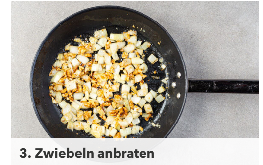
3. Zwiebeln anbraten

Die Radieschen vierteln, dabei die Enden abtrennen. Die Gurke längs halbieren und quer in dünne Scheiben schneiden. 1EL Essig, 1EL Olivenöl, 1TL Honig und 1TL Senf mit je 1 Prise Salz und Pfeffer verrühren. Die Radieschen , die Gurken , den Dill , die Minze und den Bulgur mit dem Dressing zu einem Salat vermengen.