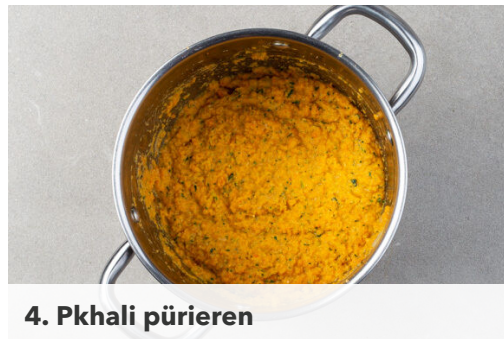
4. Pkhali pürieren

In einem kleinen Topf 400ml leicht gesalzenes Wasser für den Bulgur zum Kochen bringen. In einem mittelgroßen Topf 1L Wasser für die Karotten zum Kochen bringen. Die Karotten ggf. schälen und grob schneiden. Die Minzeblätter sowie den Dill und den Koriander samt Stängeln grob schneiden und separat beiseitelegen. Den Knoblauch schälen und grob würfeln.