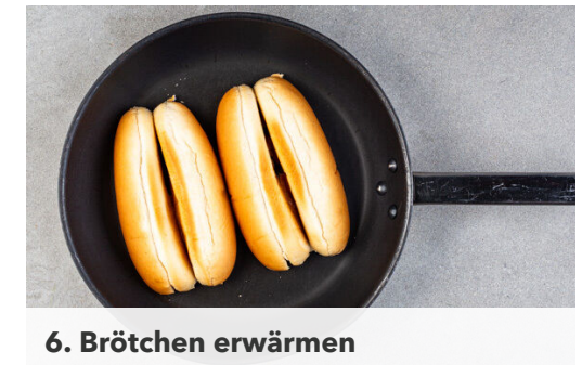
6. Brötchen erwärmen

Die Paprika aus der Pfanne nehmen, in kleine Würfel schneiden und mit dem restlichen Estragon , 1EL Essig, 1EL Zucker und 1/2TL Salz vermengen. Die 1/2 des Fetas über dem Relish zerkrümeln. Mit Salz und Pfeffer abschmecken.