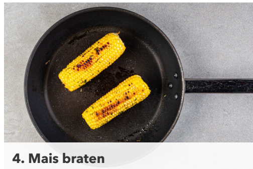
4. Mais braten

Die Hüllblätter und Fäden von den Maiskolben entfernen. Die warme Butter mit der 1/2 des Estragons vermengen und auf die Maiskolben streichen.