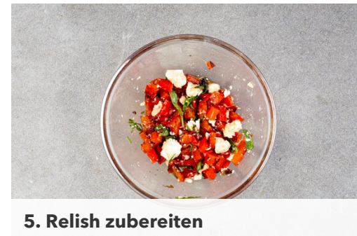
5. Relish zubereiten

Die gebratene Paprika in die Pfanne mit den Würsten geben, vom Herd nehmen und abgedeckt warm halten. Den Mais in die leere Pfanne geben und bei mittlerer Hitze 10-12Min. rundum goldbraun braten. Den Mais zum Warmhalten in die Pfanne zu der Paprika und den Würsten geben.