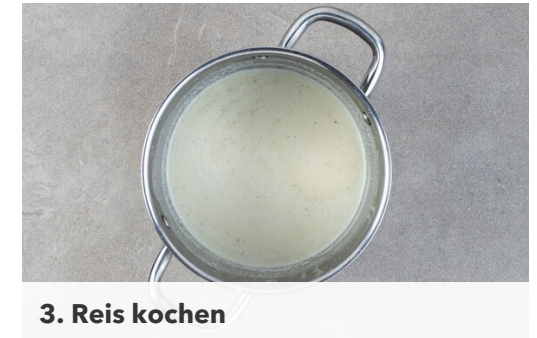
3. Reis kochen

Die Zwiebeln , die restliche Sojasauce , das restliche 5-Gewürze-Pulver und 1 Prise Chiliflocken oder mehr nach Geschmack zum Fleisch in die Pfanne geben und alles weitere 2-3Min. braten, dabei gelegentlich umrühren. Nebenher die Zucchini längs halbieren und quer in dünne Scheiben schneiden.