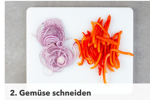
2. Gemüse schneiden

Das Fleisch samt Marinade und die Paprikastreifen in einer großen Pfanne mit 2EL Pflanzenöl bei starker Hitze 3-4Min. anbraten und mit 1-2 Prisen Pfeffer würzen.