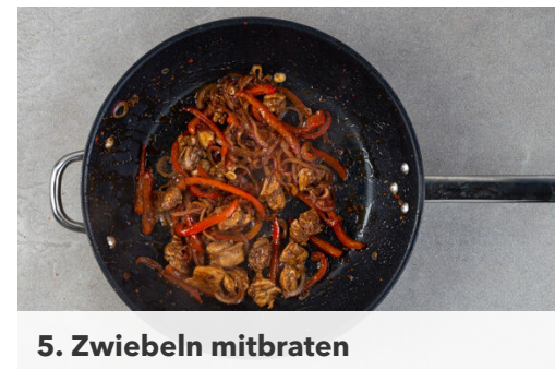
5. Zwiebeln mitbraten

Die Zwiebeln schälen und in möglichst feine Ringe schneiden. Die Paprika vierteln, entkernen und in dünne Streifen schneiden.