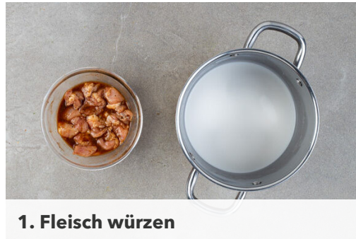
1. Fleisch würzen

Energie 987kcal, Fett 49.0g, Kohlenhydrate 94.3g, Eiweiß 40.9g