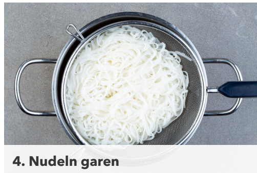
4. Nudeln garen

Den weißen und grünen Teil des Pak Choi getrennt in dünne Streifen schneiden. Die Zwiebel schälen, halbieren und in feine Streifen schneiden. Den Knoblauch schälen und fein würfeln. Die Korianderblätter abzupfen und grob schneiden, die Korianderstiele fein hacken. Die Peperoni in feine Ringe schneiden, ggf. für weniger Schärfe entkernen oder weniger verwenden.