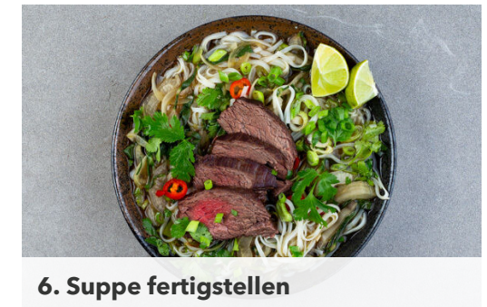
6. Suppe fertigstellen

In einem zweiten großen Topf ausreichend Wasser für die Nudeln zum Kochen bringen. Die Lauchzwiebeln schräg in dünne Ringe schneiden. 1 Limette halbieren und auspressen, die übrige Limette in Spalten schneiden.