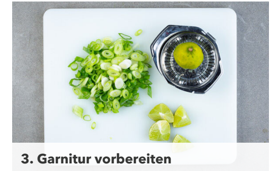
3. Garnitur vorbereiten

Das Fleisch in einer großen Pfanne mit 2EL Pflanzenöl bei starker Hitze auf jeder Seite 1-2Min. scharf anbraten, dann sofort aus der Pfanne nehmen und mit Salz würzen. Die Lauchzwiebeln und die grünen Pak-Choi-Streifen in die Suppe geben und 2-3Min. bei sehr geringer Hitze ziehen lassen. Kurz vor dem Servieren das Fleisch in dünne Tranchen schneiden.