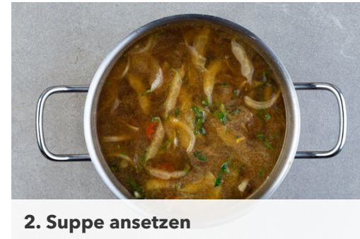
2. Suppe ansetzen

Die Nudeln in das kochende Wasser geben und gut umrühren. Den Topf vom Herd nehmen und die Nudeln ohne Hitzezufuhr 5-8Min. ziehen lassen. Sie sollen weich, aber noch bissfest sein. In ein Sieb abgießen und kalt abschrecken.