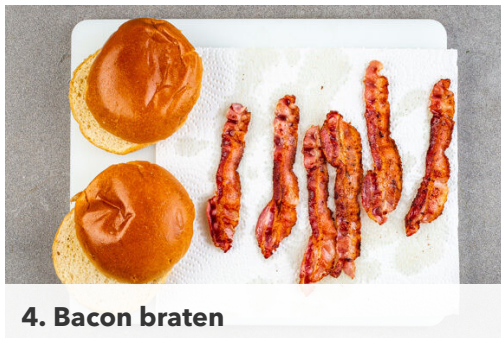
4. Bacon braten

Den Backofen auf 240°C (220°C Umluft) vorheizen. Die Kartoffeln samt Schale in pommesartige Stifte schneiden, mit 1EL Olivenöl und 1 kräftigen Prise Salz und Pfeffer auf einem mit Backpapier ausgelegten Backblech vermengen und gleichmäßig verteilen. Im Ofen 25-30Min. backen, bis die Pommes goldbraun und knusprig sind. Zur Hälfte der Backzeit einmal wenden.