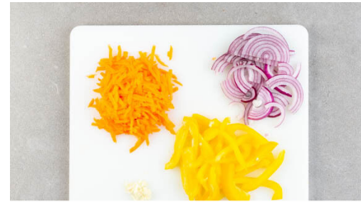
2. Gemüse schneiden

Die Zwiebel schälen, halbieren und in feine Streifen schneiden. Den Knoblauch schälen und fein würfeln. Die Paprika vierteln und entkernen, dann in dünne, lange Streifen schneiden. Die Karotte ggf. schälen und mit einer Küchenreibe grob raspeln.