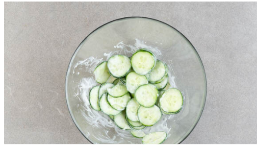
1. Gurkensalat zubereiten

Energie 834kcal, Fett 31.1g, Kohlenhydrate 94.3g, Eiweiß 43.4g