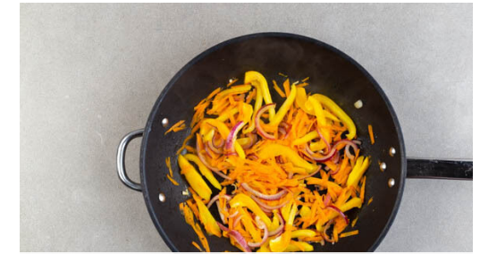
3. Gemüse braten

Das Fleisch trocken tupfen, zu dem Gemüse in die Pfanne geben und bei starker Hitze 3-5Min. braten, je nachdem, ob es medium oder durch sein soll. 2EL Wasser dazugeben und mit Salz und Pfeffer abschmecken.