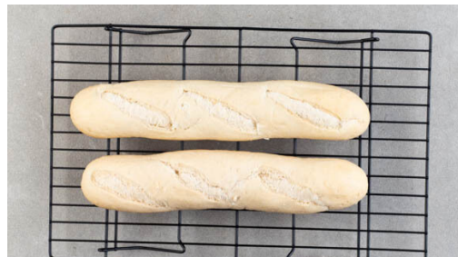
4. Brötchen aufbacken

Den Backofen auf 220°C (200°C Umluft) vorheizen. Die Gurke in dünne Scheiben schneiden. 1EL Mayonnaise mit 2TL Essig sowie je 1 Prise Salz und Zucker verrühren, dann mit den Gurken vermengen. Mit Pfeffer und ggf. mehr Salz abschmecken.