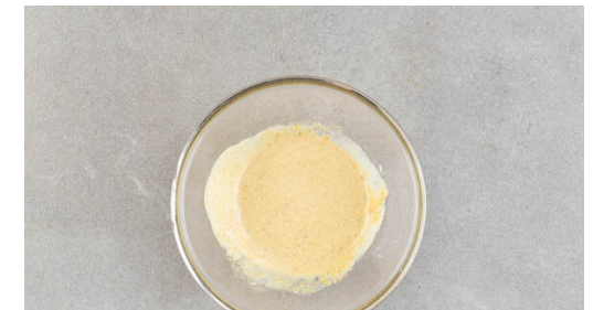
6. Dip anrühren

Die Zwiebeln in einer großen Pfanne mit 1EL Pflanzenöl bei mittlerer Hitze 2-3Min. anschwitzen, bis sie weich sind. Den Knoblauch , die Paprika und die Karotten hinzufügen und 4-5Min. mitbraten, bis das Gemüse ebenfalls etwas weicher ist. Mit Salz und Pfeffer abschmecken.