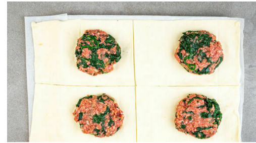
2. Teigtaschen füllen

Die Zucchini mit einem Sparschäler rundum in lange, breite Streifen schneiden. Die Zitronenschale abreiben, dann die Zitrone halbieren und auspressen. Die Minzeblätter von den Stängeln zupfen und fein schneiden.