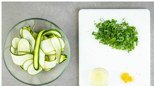
4. Zutaten vorbereiten

Den Backofen auf 240°C (220°C Umluft) vorheizen. Die Zwiebeln schälen, halbieren und fein würfeln, dann in einer großen Pfanne mit 1EL Olivenöl und 1TL Salz bei mittlerer Hitze ca. 3Min. glasig anschwitzen. Den Spinat hinzufügen und ca. 5Min. mitgaren, bis er zusammenfällt. Den Spinat in ein Sieb geben und so viel Flüssigkeit wie möglich auspressen.