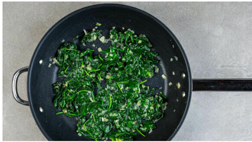
1. Spinat vorbereiten

Energie 964kcal, Fett 62.8g, Kohlenhydrate 58.7g, Eiweiß 36.1g