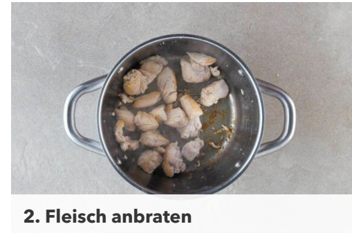
2. Fleisch anbraten

Den Blumenkohlreis auf zwei mit Backpapier ausgelegten Backblechen verteilen. Jeweils mit 1EL Pflanzenöl, 1 kräftigen Prise Salz und 1 Prise Pfeffer vermengen und ca. 10Min. im Ofen rösten, bis der Blumenkohlreis gar und an den Rändern leicht gebräunt ist. Je nach Ofen die Position der Bleche nach der Hälfte der Zeit tauschen.