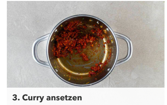
3. Curry ansetzen

150-200ml Wasser sowie je 1 Prise Salz und Pfeffer in den Topf geben, aufkochen und 3-4Min. köcheln lassen. Die Crème fraîche einrühren, dann die Paprika und das Fleisch samt Bratensaft hinzufügen und das Curry ca. 5Min. sanft köcheln lassen. Ggf. mehr Wasser hinzufügen. Mit Salz und Pfeffer abschmecken.