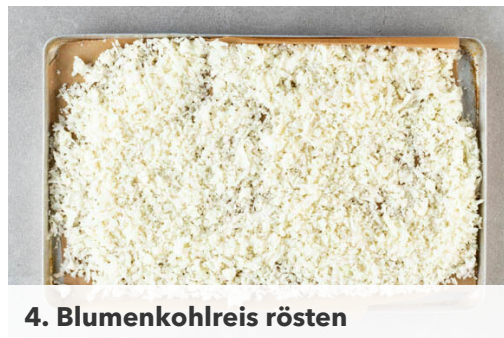
4. Blumenkohlreis rösten

Den Backofen auf 220°C (200°C Umluft) vorheizen. Die Zwiebel schälen, halbieren und fein würfeln. Den Ingwer schälen und ebenfalls fein würfeln. Die Korianderblätter abzupfen und die Stängel fein schneiden. Die Paprika vierteln, entkernen und in 1-2cm große Stücke schneiden.