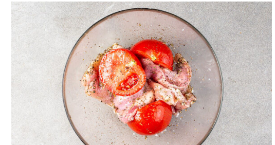
3. Fleisch vorbereiten

Das Gemüse mit der ½ der Gewürzmischung , 1EL Olivenöl, 1EL Balsamicoessig sowie je 1 Prise Salz und Pfeffer vermengen, dann gleichmäßig auf dem Backblech verteilen und im Ofen ca. 15Min. backen.