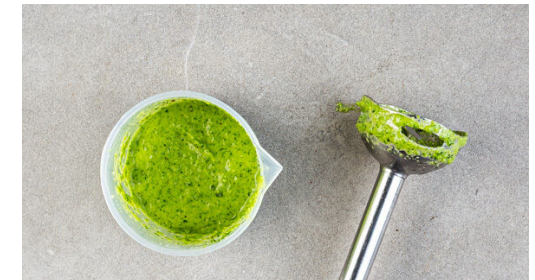
6. Creme zubereiten

In einem Wasserkocher die notwendige Mindestmenge an Wasser aufkochen und die Cashews in einem hohen Gefäß mit 40ml kochendem Wasser übergießen. Den Knoblauch schälen und grob würfeln. Das Basilikum und die Petersilie samt Stängeln grob schneiden, dabei einige Petersilienblätter für die Garnitur beiseitelegen.