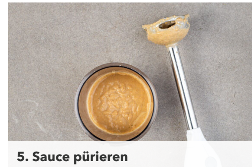
5. Sauce pürieren

Die Paprika vierteln, entkernen und in dünne Streifen schneiden, dann zu dem Hackfleisch in die Pfanne geben und in 5-6Min. weich braten. Die Gurke auf ein Brett legen und mit einer schweren Pfanne oder einem Nudelholz so lange schlagen, bis die Gurke auf- bzw. in Stücke bricht, dann grob in mundgerechte Stücke schneiden.