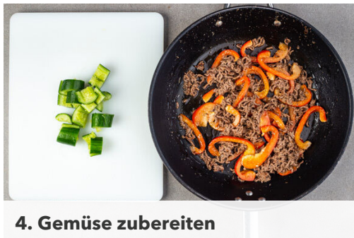
4. Gemüse zubereiten

Die Würzsauce in einer großen Pfanne mit 2EL Pflanzenöl bei mittlerer bis starker Hitze ca. 1Min. anbraten, dann das Hackfleisch zugeben und unter stetigem Rühren in 6-8Min. goldbraun und gar braten. Das hohe Gefäß aufbewahren.