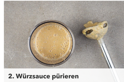
2. Würzsauce pürieren

In einem mittelgroßen Topf 800ml leicht gesalzenes Wasser zum Kochen bringen. Den Reis in einem Sieb kalt abspülen, bis das Wasser klar bleibt. Sobald das Wasser kocht, den Reis hineingeben und abgedeckt bei niedrigster Hitze 10-12Min. kochen, bis das Wasser aufgesogen und der Reis gar ist. Noch ca. 5Min. ohne Hitzezufuhr ziehen lassen.