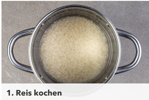
1. Reis kochen

Energie 1009kcal, Fett 52.1g, Kohlenhydrate 99.3g, Eiweiß 36.1g