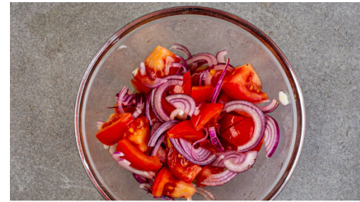
2. Salat zubereiten

Die restlichen Zwiebeln in derselben Pfanne mit 1TL Butter und 1 Prise Salz bei mittlerer bis starker Hitze 2-3Min. anbraten, bis sie weich sind und zu bräunen beginnen.