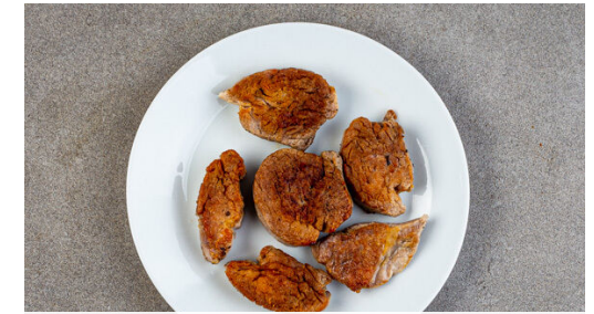
3. Fleisch braten

Die Zwiebeln mit 1TL Brügewürz und 2TL Mehl bestäuben und weitere 1-2Min. braten. Dann mit 250ml Kochwasser ablöschen und 2TL Senf unterrühren. Die Sauce 3-4Min. einköcheln lassen, dann mit Salz und Pfeffer abschmecken und die Pfanne vom Herd nehmen. Das Fleisch in die Sauce geben, um es warm zu halten.