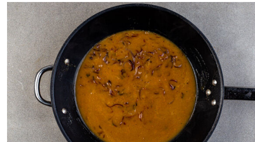
5. Sauce köcheln

1EL Olivenöl, 2EL Essig und ½TL Honig zu einem Dressing verrühren und mit Salz und Pfeffer abschmecken. Die Tomaten in mundgerechte Stücke schneiden. Die Zwiebel schälen, halbieren und in feine Streifen schneiden. Die Tomaten und ca. ⅓ der Zwiebeln mit dem Dressing vermengen und ggf. erneut mit Salz und Pfeffer abschmecken.