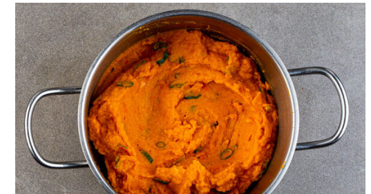
6. Gemüse stampfen

Das Fleisch trocken tupfen, in 6 gleich große Medaillons schneiden und mit je 1 kräftigen Prise Salz und Pfeffer würzen. Die Medaillons in einer mittelgroßen Pfanne mit 1EL Olivenöl bei starker Hitze auf jeder Seite 2-3Min. braten. Aus der Pfanne nehmen und bis zum Servieren auf einem Teller abgedeckt ruhen lassen.