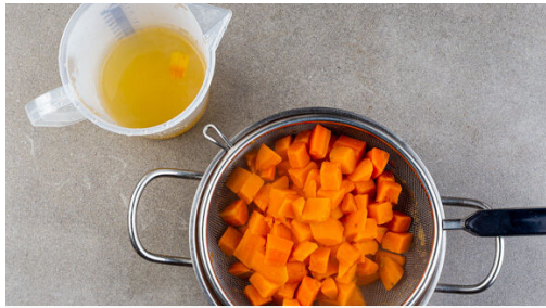
1. Gemüse kochen

Energie 592kcal, Fett 24.9g, Kohlenhydrate 52.2g, Eiweiß 35.0g