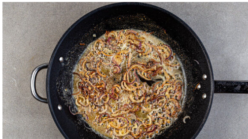
4. Zwiebeln anbraten

In einem mittelgroßen Topf ausreichend leicht gesalzenes Wasser für die Süßkartoffeln und die Karotten zum Kochen bringen. Die Süßkartoffeln schälen und in ca. 2cm große Stücke schneiden. Die Karotte ggf. schälen und ebenfalls in ca. 2cm große Stücke schneiden. Das Gemüse in den Topf geben und in 10-12Min. gar kochen. In ein Sieb abgießen, das Kochwasser auffangen.