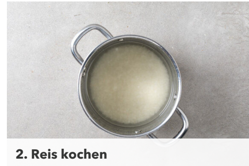
2. Reis kochen

In einer mittelgroßen Pfanne 1EL Pflanzenöl bei mittlerer Hitze erwärmen. Den Knoblauch und den Spinat in das heiße Öl geben und den Spinat 1–2Min. unter Rühren zusammenfallen lassen. Mit je 1 Prise Salz und Pfeffer würzen und auf einem Teller beiseitestellen.