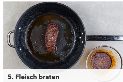
5. Fleisch braten

Den Reis in einem Sieb unter fließendem Wasser abspülen, bis das Wasser klar bleibt. Sobald das Wasser kocht, den Reis hineingeben und abgedeckt bei niedrigster Hitze 10–12Min. kochen, bis das Wasser aufgesogen und der Reis gar ist. Noch ca. 5Min. ohne Hitzezufuhr ziehen lassen.