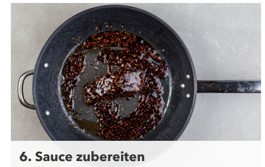
6. Sauce zubereiten

Den Rotkohl mit 1 kräftigen Prise Salz 2–3Min. durchkneten, bis der Kohl weich wird. Dabei am besten Küchenhandschuhe tragen. Die Karotten , den Ingwer , 1EL Pflanzenöl und 2EL hellen Essig untermengen und den Salat mit 1–2EL Sojasauce , ½TL Zucker sowie Salz und Pfeffer nach Geschmack würzen.