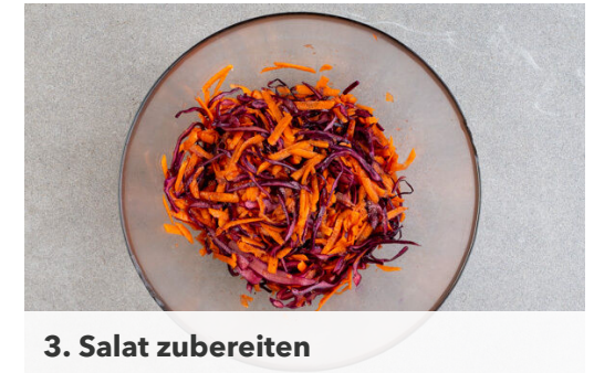
3. Salat zubereiten

Die Teriyakisauce mit der restlichen Sojasauce , 1EL hellem Essig und 1TL Mehl verrühren, dann den Sesam unterrühren. Das Fleisch mit etwas Küchenkrepp trocken tupfen, von beiden Seiten mit Salz und Pfeffer würzen und in der Pfanne mit 1EL Pflanzenöl bei starker Hitze auf jeder Seite 2–4Min. scharf anbraten.