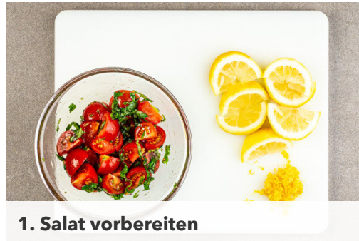
1. Salat vorbereiten

Energie 633kcal, Fett 32.1g, Kohlenhydrate 38.3g, Eiweiß 42.4g