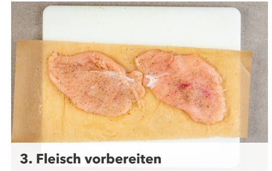
3. Fleisch vorbereiten

In einer großen Pfanne 3EL Olivenöl bei mittlerer Hitze erwärmen. Die Schnitzel in das heiße Öl geben und auf jeder Seite 4-5Min. goldbraun anbraten. Falls die Panade zu schnell bräunt, die Hitze etwas reduzieren. Tipp: Je nach Größe der Pfanne ggf. eine zweite Pfanne verwenden.