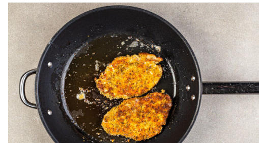
5. Schnitzel braten

Den Brokkoli in mundgerechte Röschen schneiden, auf einem mit Backpapier ausgelegten Backblech mit 2EL Olivenöl und je 1 kräftigen Prise Salz und Pfeffer vermengen und 10-15Min. im Ofen rösten, bis der Brokkoli leicht gebräunt und gar ist.