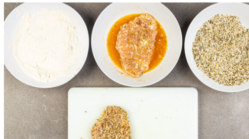
4. Fleisch panieren

Den Backofen auf 220°C (200°C Umluft) vorheizen. Die Kirschtomaten vierteln. Das Basilikum samt Stängeln grob schneiden und mit den Tomaten in eine Schüssel geben. Aus je 2EL Olivenöl und Essig sowie je 1 kräftigen Prise Salz und Pfeffer ein Dressing anrühren, aber noch nicht mit den Tomaten mischen. Die Zitronenschale abreiben, dann die Zitrone in Spalten schneiden.