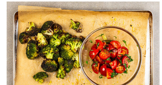
6. Brokkoli verfeinern

Das Fleisch trocken tupfen, jeweils horizontal halbieren und zwischen zwei Lagen Backpapier oder Frischhaltefolie z. B. mit einem schweren Topf gleichmäßig ca. 0,5 cm dünn flach klopfen. Von beiden Seiten mit je 1 Prise Salz und Pfeffer würzen.