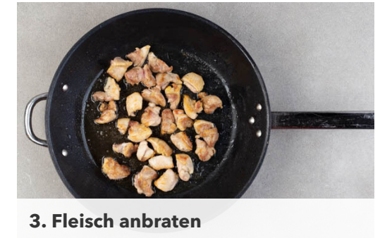
3. Fleisch anbraten

Die Limettenschale fein abreiben und die Limette in 6 Spalten schneiden. Die Chilischote längs halbieren und in hauchdünne Streifen schneiden. Tipp: Für weniger Schärfe die Kerne entfernen. Die Thai-Basilikumblätter von den Stängeln zupfen.