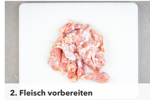
2. Fleisch vorbereiten

Die Süßkartoffeln und den Knoblauch dazugeben und bei mittlerer Hitze ca. 3Min. mitbraten. Dann mit der Sojasauce , der Fischsauce und 80ml Wasser ablöschen. ½TL (braunen) Zucker einrühren, die Flüssigkeit aufkochen lassen und weitere ca. 6Min. köcheln. Den Pak Choi für die letzten 3Min. dazugeben und mitgaren.