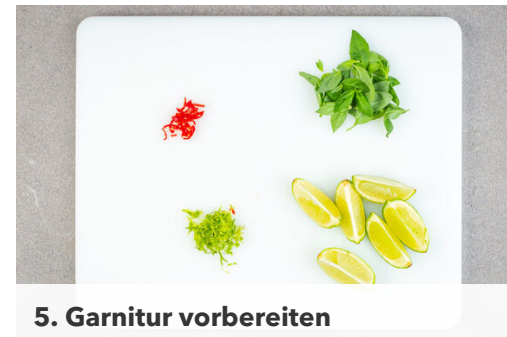
5. Garnitur vorbereiten

Das Fleisch trocken tupfen, in 1-2cm dünne Streifen schneiden und mit 1 kräftigen Prise Salz würzen. Anschließend in 1EL Speisestärke wenden, überschüssige Stärke leicht abklopfen.